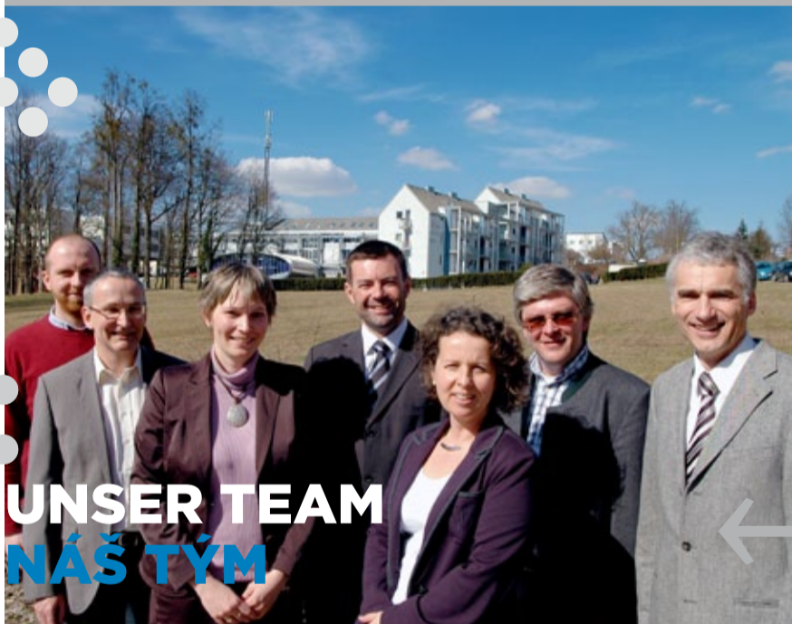
UNSER TEAM NAŠ TÝM